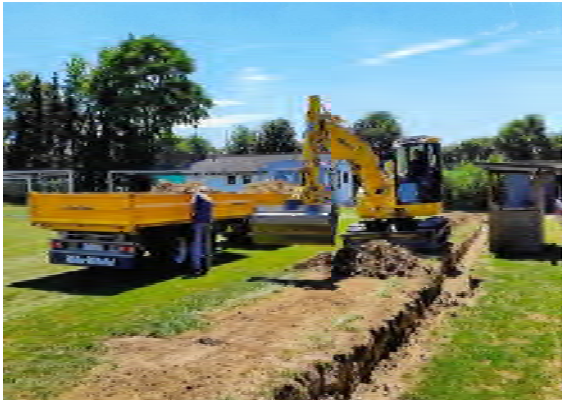
Die Erdarbeiten auf dem B-Platz.