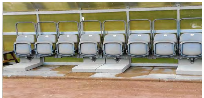
Die neue Reservebankanlage auf dem A-Platz