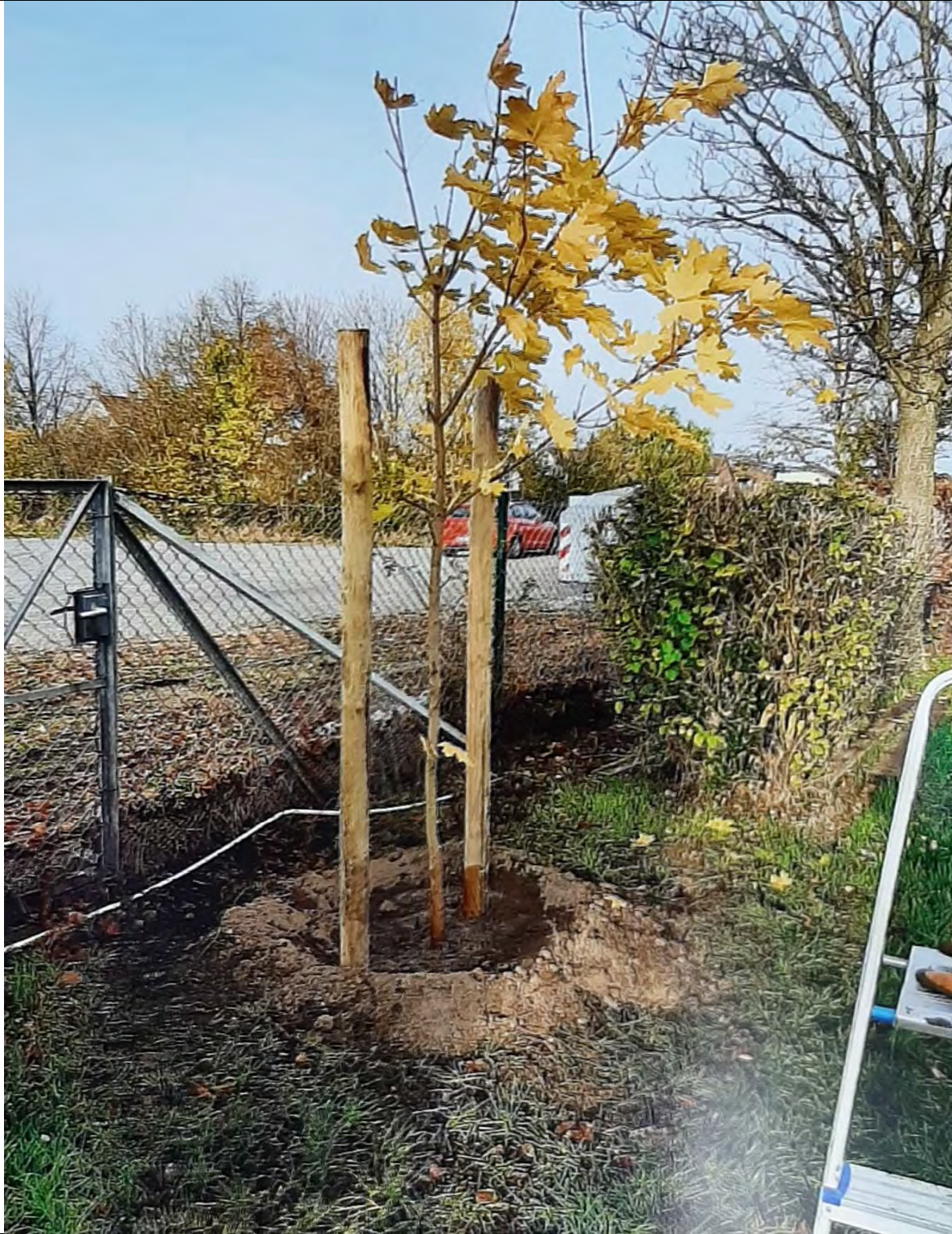
Auf dem B-Platz wurden zwei neue Bäume gepflanzt