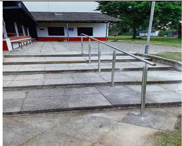
Neuer Treppenhandlauf am Sportheim