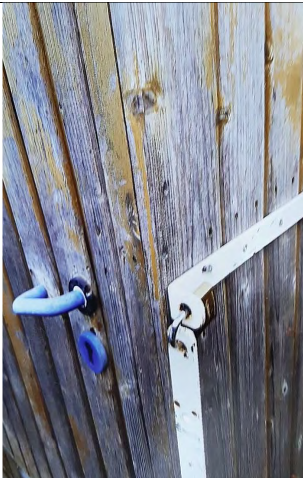
Zerstörung des Eingangs der Hütte