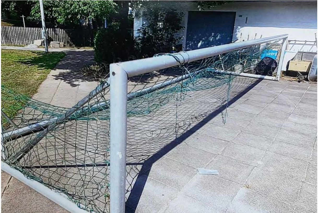
Transport der Tore aus Volzum durch die Firma VTL GmbH zum MTV