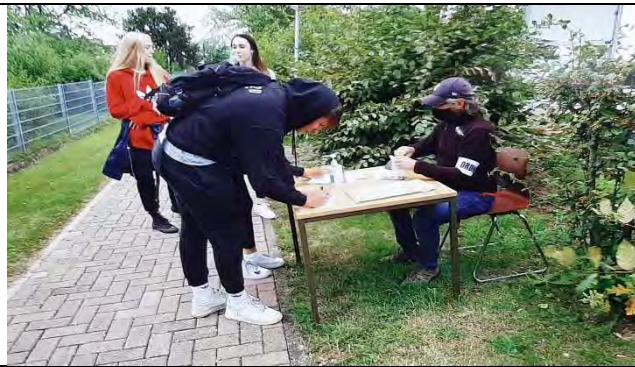
Sperrung des Sportplatzes; Einlasskontrolle beim Punktspiel der 1. Herren (Corona-Pandemie)