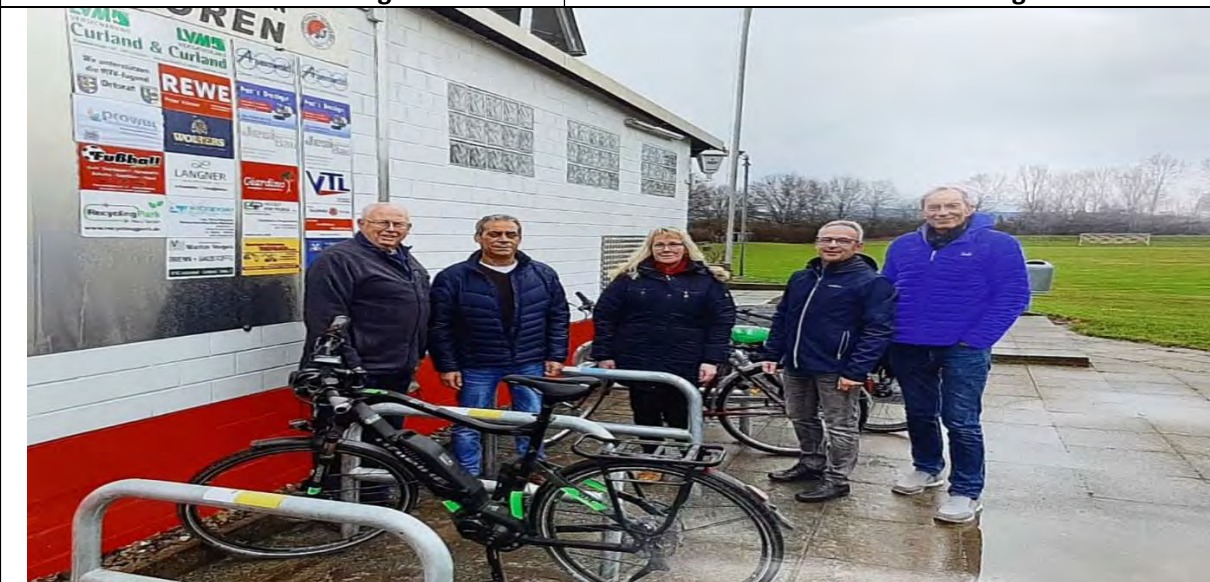
Einweihung der neuen Fahrradbügel mit Politik, Wirtschaft und Verein...