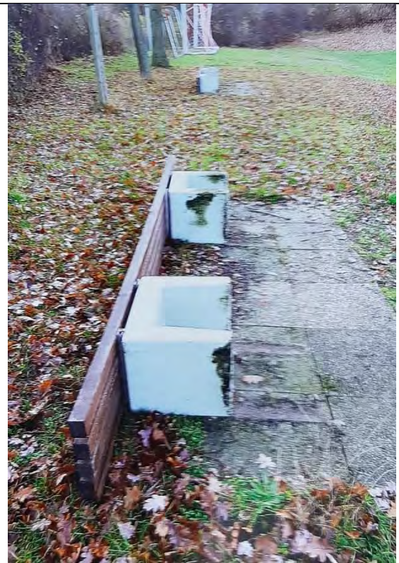
Erneuter Vandalismus auf dem Gelände