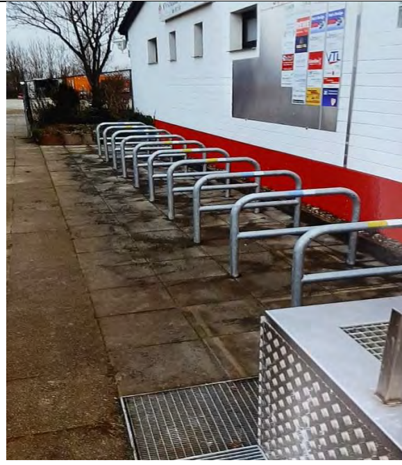
Die neuen Fahrradbügel