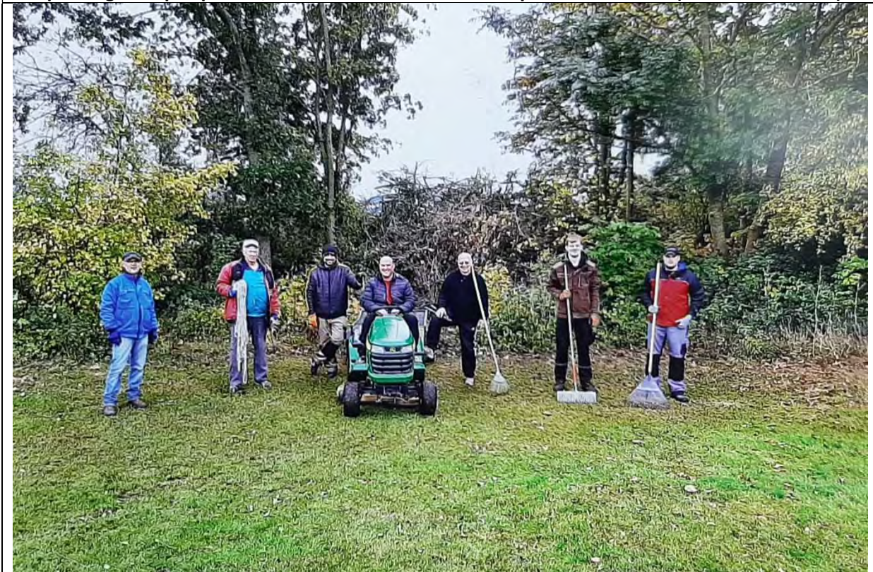
Sträucherschnitt auf dem Gelände am 17.10.2020